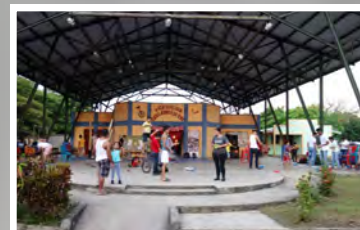
2017: ein normaler Trainingstag im CCCM

Austausch, Training, Vorstellungen, Qualifizierung, Umsetzung neuer Themen, z.B. Ökologie.