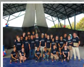
2013: Einweihung des Kulturzentrums CCCM