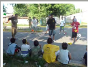
Bis 2012: Training auf der Straße